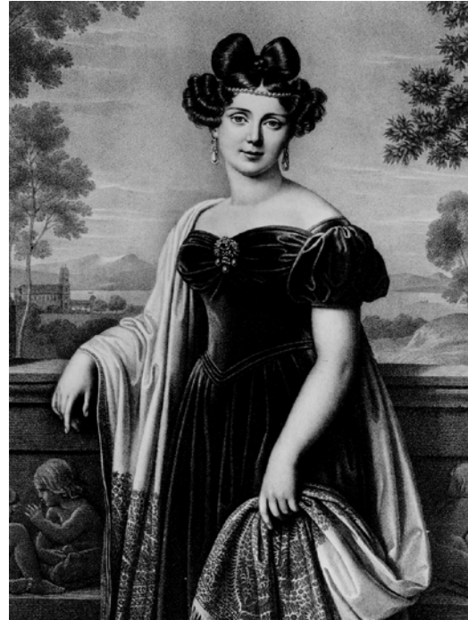
Pauline von Württemberg, Württ. Königin